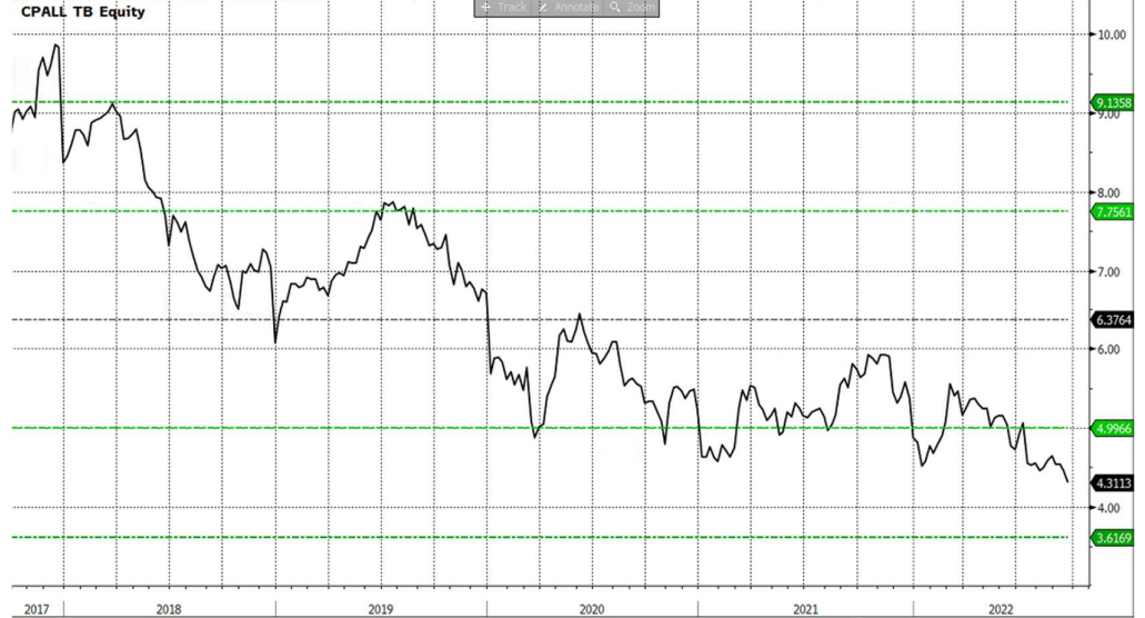
รูปที่ 1: PBV ของ CPALL ล่าสุด