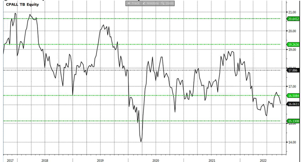
รูปที่ 2: EV/EBITDA ของ CPALL ล่าสุด