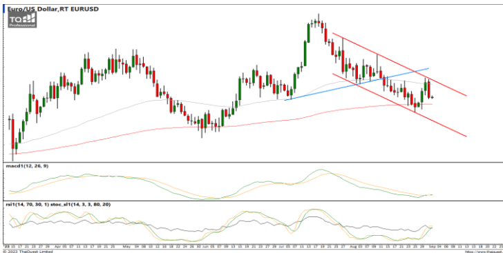
กลยุทธ์ Trading ในรอบ 1.0766 – 1.0923

แนวรับ 34.70 / 34.40 แนวต้าน 35.10 / 35.30