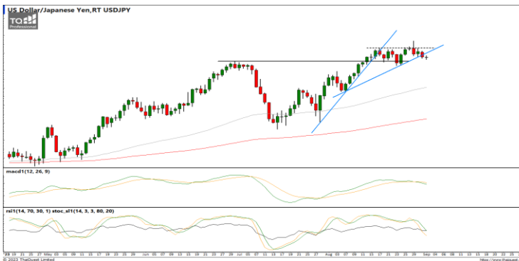
กลยุทธ์ Hold Short 146.00 รอเปิดเพิ่ม 147.00 Stop >147.40

แนวรับ 1.0810 / 1.0766 แนวต้าน 1.0885 / 1.0923