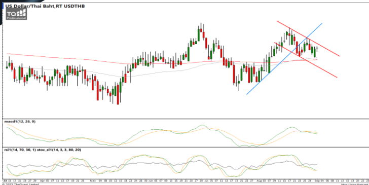
กลยุทธ์ Trading Short ในรอบ 35.10 – 34.40

USDTHB : ภาพรายวัน ราคาอยู่ในกรอบทิศทางแนวโน้มขาลงพยายามปรับตัวขึ้นทดสอบแนวต้านที่กรอบดังกล่าว ขณะที่เครื่องมือทางเทคนิค MACD ให้สัญญาณขาย พร้อม RSI และ SSto ยังอ่อนกำลังอยู่ ทำให้คาดว่าราคามีโอกาสแกว่งตัวออกด้านข้างได้ต่อ