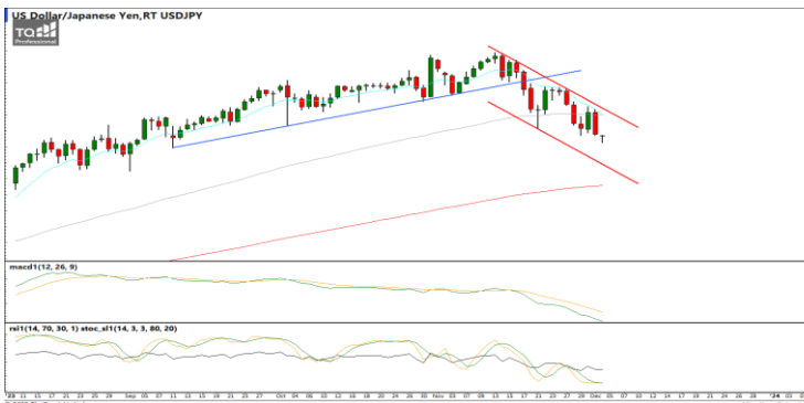
กลยุทธ์ Hold Short 151.0 Let's Profit Run Stop >148.6

แนวรับ 1.0830 / 1.0760 แนวต้าน 1.0920 / 1.1000