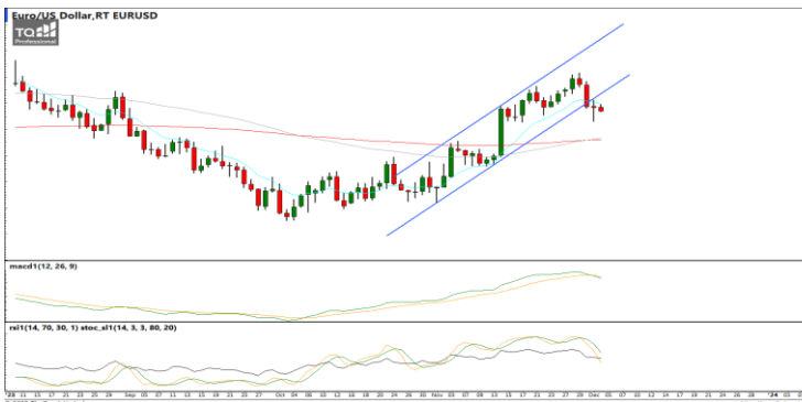
กลยุทธ์ Trading ในรอบ 1.0760 – 1.1000

แนวรับ 35.00 / 34.50 แนวต้าน 35.35 / 35.55