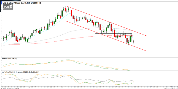
กลยุทธ์ Trading Short ในรอบ 35.50 – 34.50