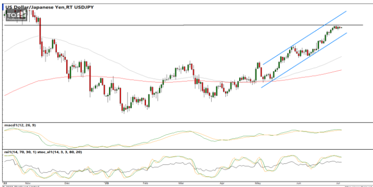
กลยุทธ์ Hold Short 145.00 รอเปิดเพิ่ม 146.00 Stop >147.00

EURUSD : ภาพรายวัน ราคาเริ่มชะลอกำลังลงอีกครั้งทำจุดสูงสุดใหม่ในภาพระยะสั้นต่ำลง ขณะที่เครื่องมือทางเทคนิค MACD, RSI และ SSto ให้สัญญาณขาย ทำให้คาดว่าราคามีโอกาสอ่อนตัวลงได้ต่อ แนวรับ 1.0835 / 1.0779 แนวต้าน 1.0891 / 1.0934