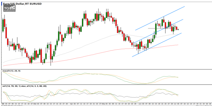
กลยุทธ์ Hold Short 1.0958 Target 1.0780 Stop >1.1012

USDTHB : ภาพรายวัน ราคาฟื้นตัวขึ้น ทดสอบแนวต้านที่เส้นแนวโน้มขาขึ้นก่อนหน้านี้แล้ว ไม่ผ่านอ่อนตัวลงอีกครั้งเคลื่อนไหวต่ำกว่า จุดสูงสุดก่อนหน้านี้ ขณะที่เครื่องมือทางเทคนิค MACD, RSI และ SSto ยังอ่อนกำลังอยู่ ทำให้คาดว่าราคามีโอกาสแกว่งตัวออกด้านข้างได้ แนวรับ 34.60 / 34.40 แนวต้าน 35.10 / 35.40