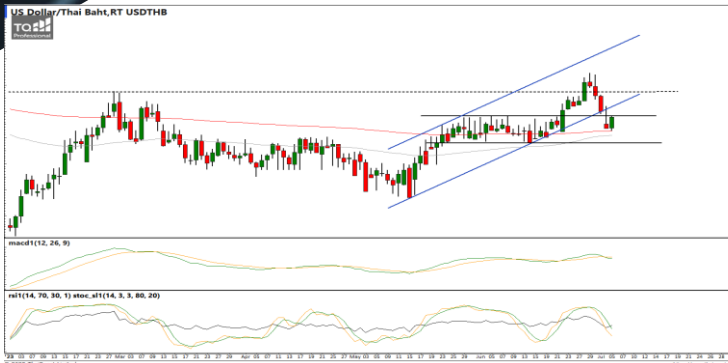
กลยุทธ์ Trading Short ในโซน 35.20 – 34.40

USDTHB : ภาพรายวัน ราคาฟื้นตัวขึ้น ทดสอบแนวต้านที่เส้นแนวโน้มขาขึ้นก่อนหน้านี้แล้ว ไม่ผ่านอ่อนตัวลงอีกครั้งเคลื่อนไหวต่ำกว่า จุดสูงสุดก่อนหน้านี้ ขณะที่เครื่องมือทางเทคนิค MACD, RSI และ SSto ยังอ่อนกำลังอยู่ ทำให้คาดว่าราคามีโอกาสแกว่งตัวออกด้านข้างได้ แนวรับ 34.60 / 34.40 แนวต้าน 35.10 / 35.40