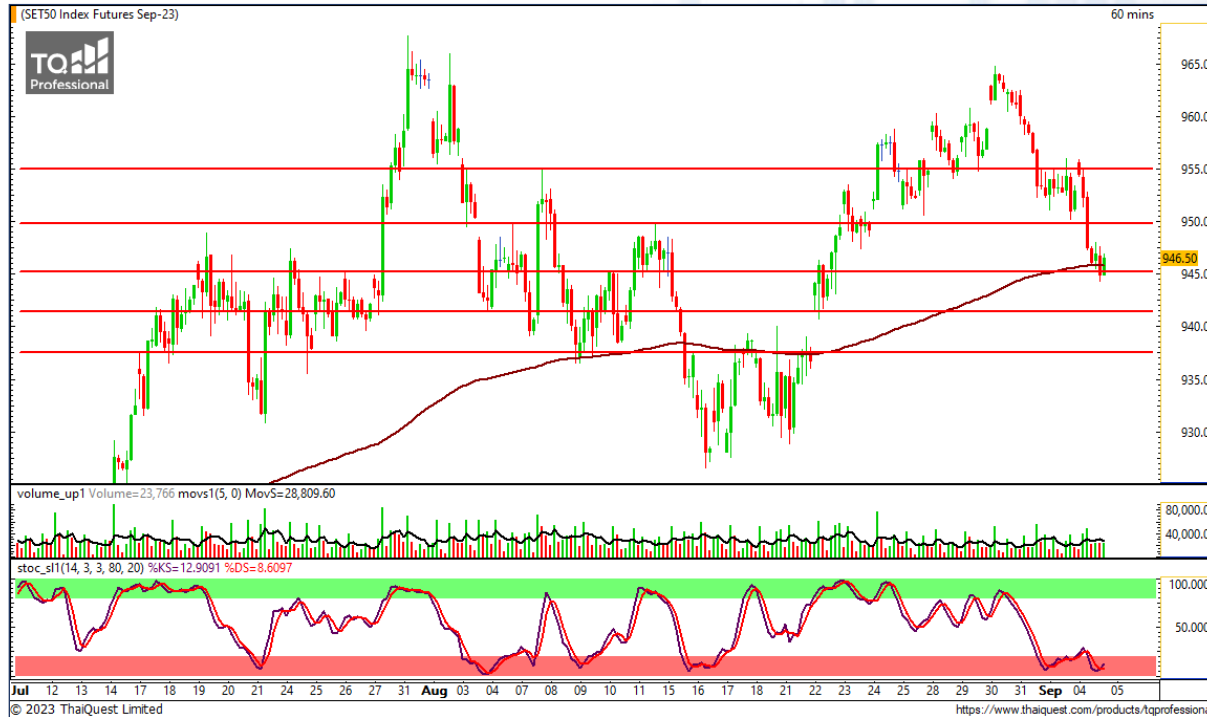
CHART INSIGHT SET50 Index Futures