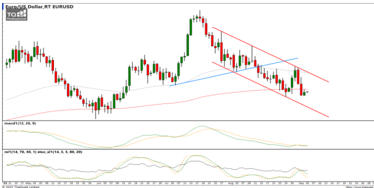
กลยุทธ์ Trading Short ในรอบ 1.0714 – 1.0911

USDTHB : ภาพรายวัน ราคาแกว่งตัวขึ้น Breakout แนวต้านที่เส้นแนวโน้มขาลงระยะสั้น พยายามทำจุดสูงสุดใหม่ ขณะที่เครื่องมือทางเทคนิค MACD วกตัวขึ้น พร้อม RSI และ SSto กลับมาให้สัญญาณซื้อ ทำให้คาดว่าราคามีโอกาสแกว่งตัวออกด้านข้างอิงทางบวกได้ แนวรับ 35.00 / 34.65 แนวต้าน 35.30 / 35.70