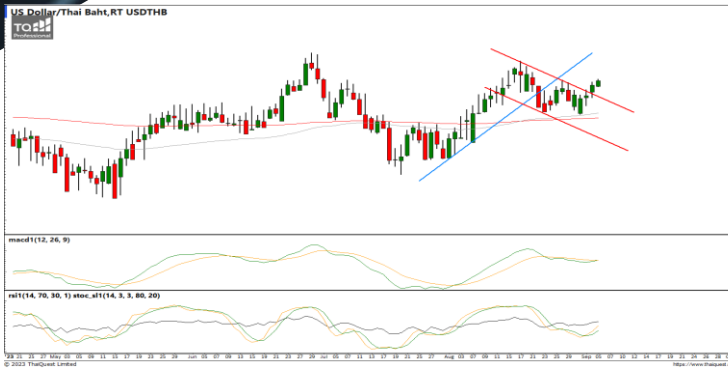
กลยุทธ์ Trading ในกรอบ 34.90 – 35.50

USDTHB : ภาพรายวัน ราคาแกว่งตัวขึ้น Breakout แนวต้านที่เส้นแนวโน้มขาลงระยะสั้น พยายามทำจุดสูงสุดใหม่ ขณะที่เครื่องมือทางเทคนิค MACD วกตัวขึ้น พร้อม RSI และ SSto กลับมาให้สัญญาณซื้อ ทำให้คาดว่าราคามีโอกาสแกว่งตัวออกด้านข้างอิงทางบวกได้ แนวรับ 35.00 / 34.65 แนวต้าน 35.30 / 35.70