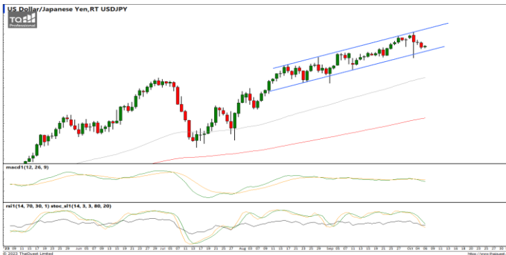
กลยุทธ์ Trading ในกรอบ 1.0440 – 1.0615

USDJPY : ภาพรายวัน ราคาแกว่งตัวออกด้านข้างในกรอบจำกัดเริ่มลงเข้าใกล้แนวรับที่เส้นแนวโน้มขาขึ้นแล้ว ขณะที่เครื่องมือทางเทคนิค MACD, RSI และ SSto ให้สัญญาณขาย ทำให้คาดว่าราคามีโอกาสแกว่งตัวออกด้านข้างอิงทางลงได้ต่อ แนวรับ 148.00 / 147.00 แนวต้าน 149.30 / 151.00