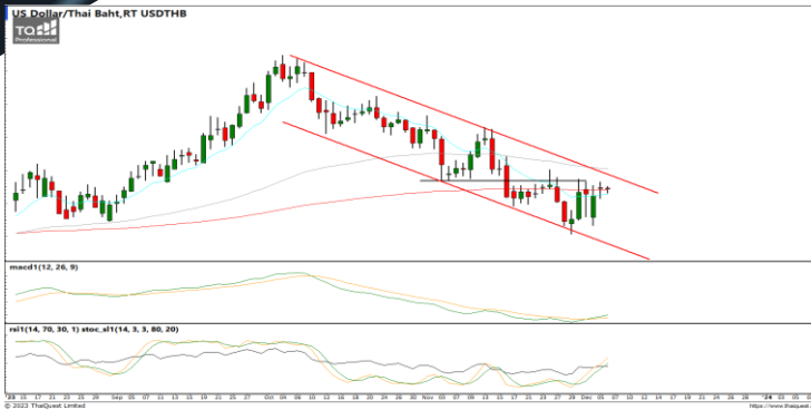
กลยุทธ์ Trading ในรอบ 34.50 – 35.40

USDTHB : ภาพรายวัน ราคาเริ่มไม่ทำจุดต่ำสุดใหม่ในภาพระยะสั้นพยายามแกว่งตัวออกด้านข้าง ขณะที่เครื่องมือทางเทคนิค MACD, RSI และ SSto พยายามฟื้นตัวขึ้น ทำให้คาดว่าราคามีโอกาสแกว่งตัวออกด้านข้างได้