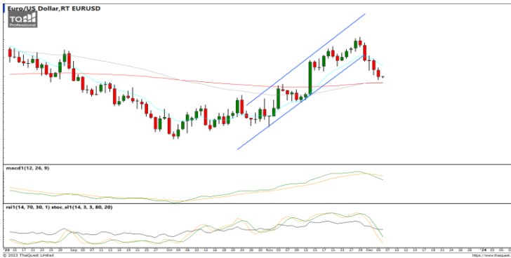
กลยุทธ์ Trading ในรอบ 1.0760 – 1.0950

แนวรับ 35.00 / 34.50 แนวต้าน 35.35 / 35.55