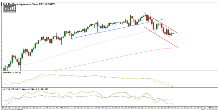
กลยุทธ์ Hold Short 151.0 Let's Profit Run Stop >148.6

แนวรับ 1.0800 / 1.0760 แนวต้าน 1.0880 / 1.0950