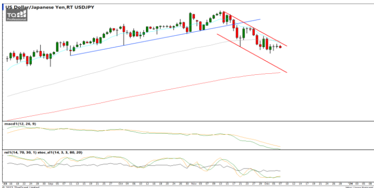
กลยุทธ์ Hold Short 151.0 Let's Profit Run Stop >148.6

EURUSD : ภาพรายวัน ราคาอ่อนตัวลงเข้าใกล้แนวรับที่ EMA75 และ 200 วันแล้ว ขณะที่เครื่องมือทางเทคนิค MACD, RSI และ SSto ยังให้สัญญาณขาย ทำให้คาดว่าราคามีโอกาสแกว่งตัวออกด้านข้างได้ แนวรับ 1.0760 / 1.0660 แนวต้าน 1.0860 / 1.0950