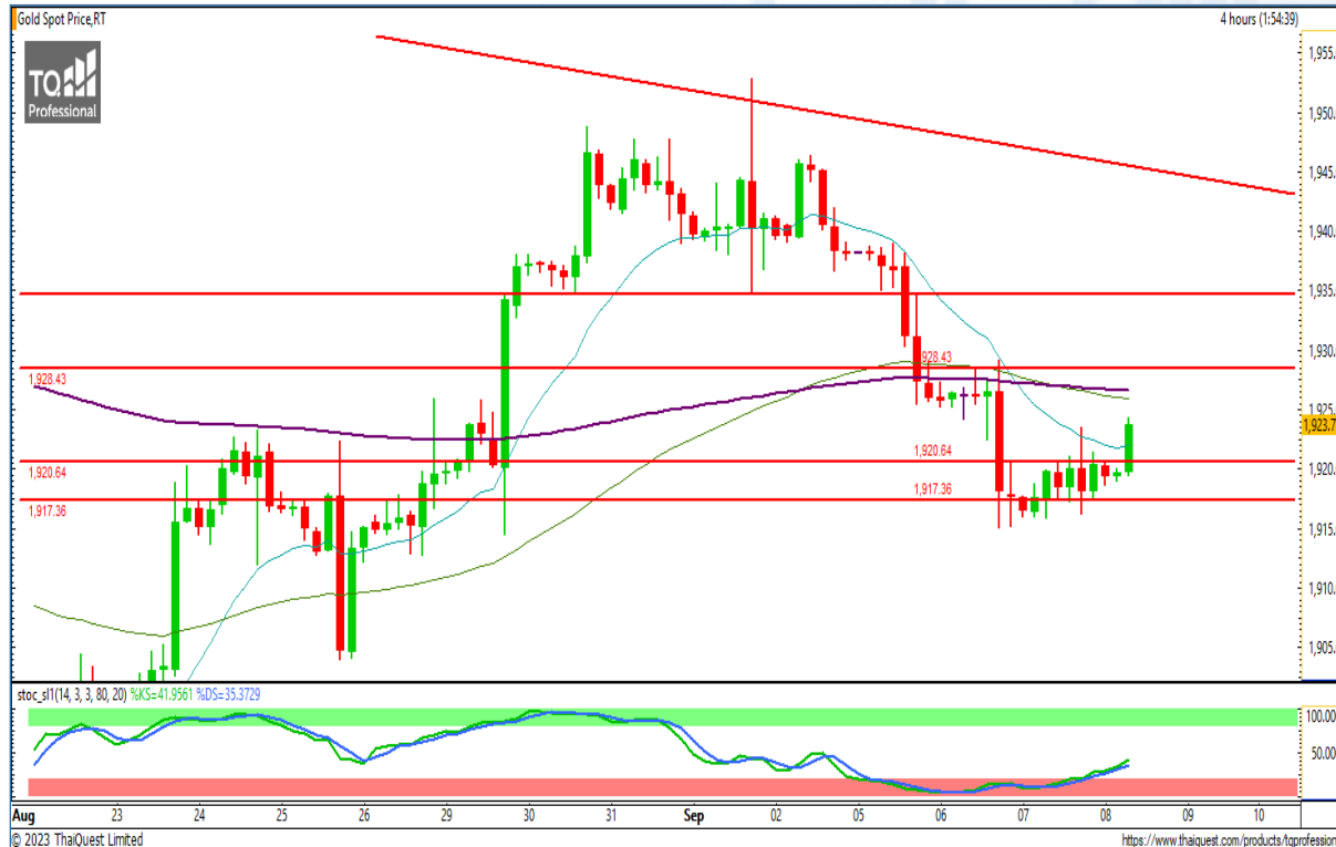
CHART INSIGHT | Gold Futures