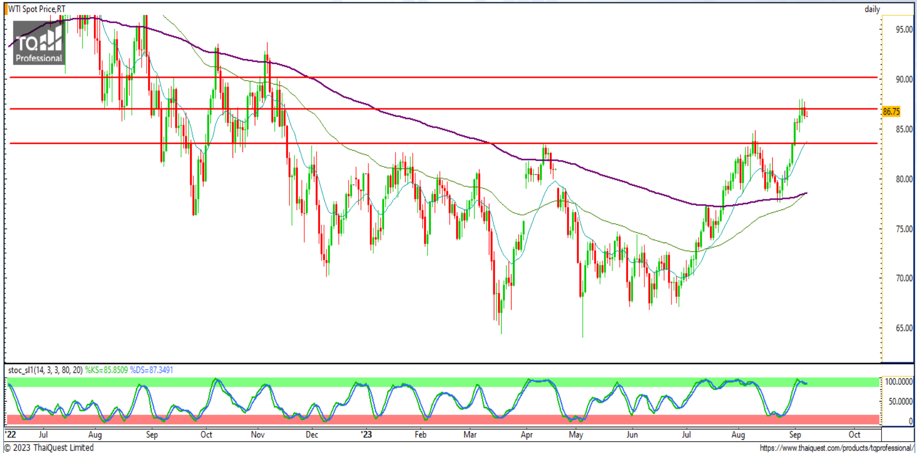
CHART INSIGHT Commodity Market