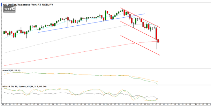
กลยุทธ์ Hold Short 151.0 Let's Profit Run Trailing Stop >147.5

EURUSD : ภาพรายวัน ราคาอ่อนตัวลงเข้าใกล้แนวรับที่ EMA75 และ 200 วันแล้วชะลอการอ่อนตัวลงพยายามฟื้นตัวขึ้น ขณะที่เครื่องมือทางเทคนิค MACD ให้สัญญาณขาย แต่ RSI และ SSto ชะลอการอ่อนตัวลงบ้างแล้ว ทำให้คาดว่าราคามีโอกาสแกว่งตัวออกด้านข้างได้ แนวรับ 1.0760 / 1.0660 แนวต้าน 1.0860 / 1.0950