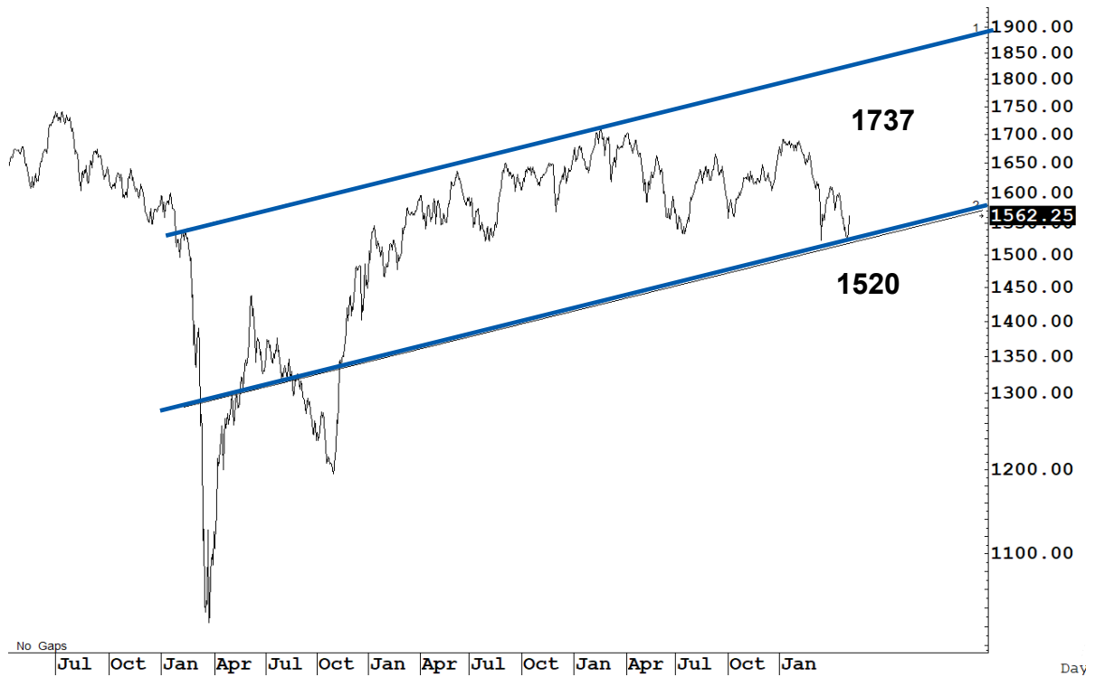
Figure 1 : SET Index daily chart