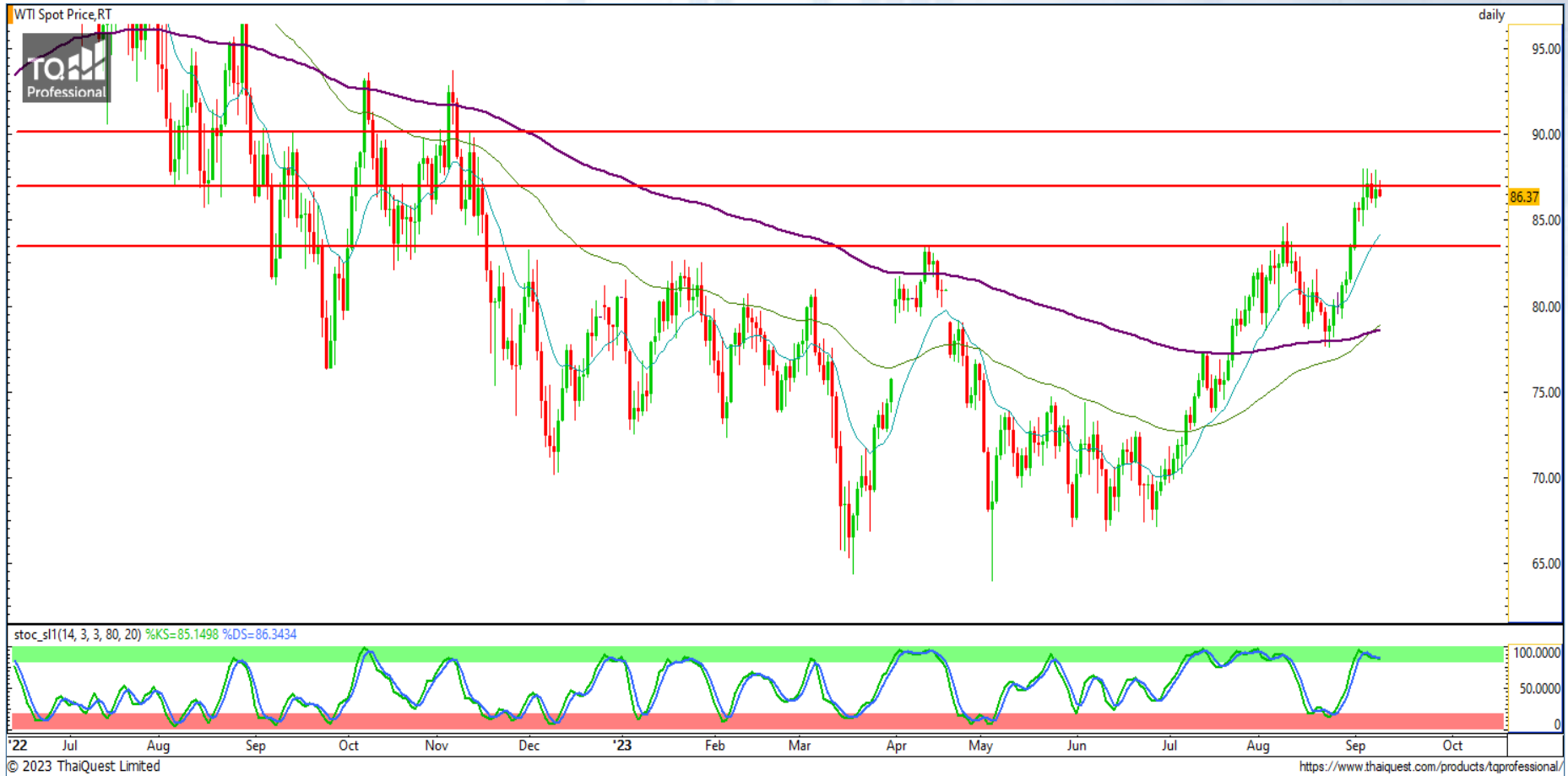
CHART INSIGHT Commodity Market