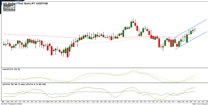
กลยุทธ์ Trading ในกรอบ 34.70 – 35.30

USDTHB : ภาพรายวัน ราคาแกว่งตัวในกรอบทิศทางแนวโน้มขาขึ้นพยายามทำจุดสูงสุดใหม่ต่อเนื่อง ขณะที่เครื่องมือทางเทคนิค MACD และ RSI ให้สัญญาณซื้อ แต่ SSTO อยู่ในภาวะ Overbought แล้ว ทำให้คาดว่าราคามีโอกาสแกว่งตัวออกด้านข้างอิงทางบวกได้ แนวรับ 34.07 / 34.30 แนวต้าน 35.30 / 35.70