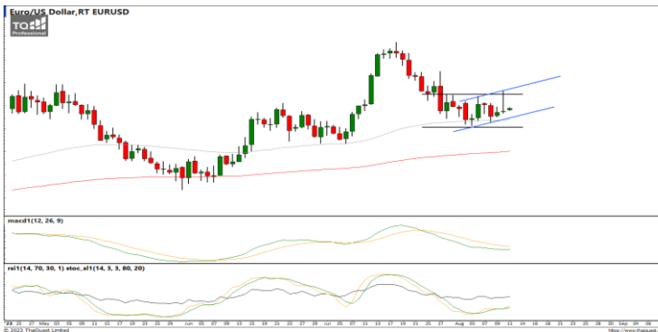
กลยุทธ์ Trading ในกรอบ 1.0940 – 1.1050

USDTHB : ภาพรายวัน ราคาแกว่งตัวในกรอบทิศทางแนวโน้มขาขึ้นพยายามทำจุดสูงสุดใหม่ต่อเนื่อง ขณะที่เครื่องมือทางเทคนิค MACD และ RSI ให้สัญญาณซื้อ แต่ SSTO อยู่ในภาวะ Overbought แล้ว ทำให้คาดว่าราคามีโอกาสแกว่งตัวออกด้านข้างอิงทางบวกได้ แนวรับ 34.07 / 34.30 แนวต้าน 35.30 / 35.70