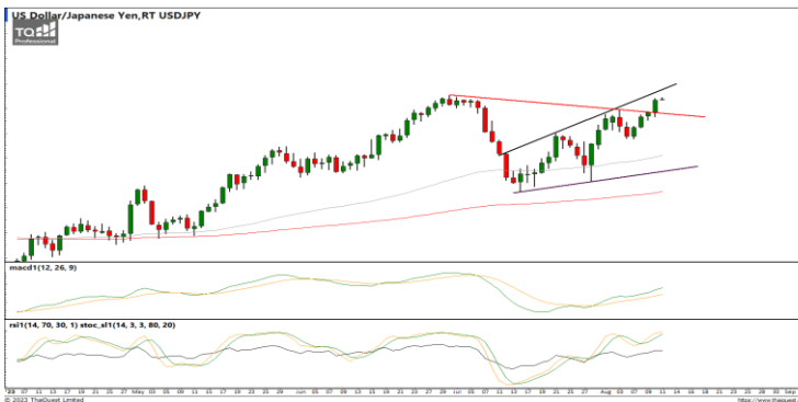
กลยุทธ์ Wait and see.

EURUSD : ภาพรายวัน ราคาพยายามปรับตัวขึ้นทำจุดสูงสุดใหม่ในภาพระยะสั้นแต่ยังอ่อนกำลังอยู่ ขณะที่เครื่องมือทางเทคนิค MACD, RSI และ SSTO พยายามฟื้นตัวขึ้น ทำให้คาดว่าราคามีโอกาสแกว่งตัวออกด้านข้างอิงทางบวกได้ แนวรับ 1.0940 / 1.0911 แนวต้าน 1.1050 / 1.1150