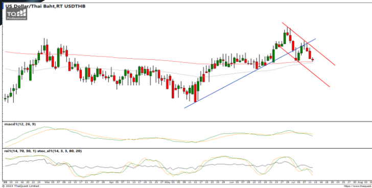
กลยุทธ์ Trading Short ในรอบ 34.90 – 34.20

USDTHB : ภาพรายวัน ราคายังคงอ่อนตัวลงพยายามทำจุดต่ำสุดใหม่ในภาพระยะสั้นทดสอบแนวรับที่ EMA200 วัน ขณะที่เครื่องมือทางเทคนิค MACD, RSI และ SSTO ให้สัญญาณขาย ทำให้คาดว่าราคามีโอกาสอ่อนตัวลงได้ต่อ แนวรับ 34.60 / 34.20 แนวต้าน 34.90 / 35.10