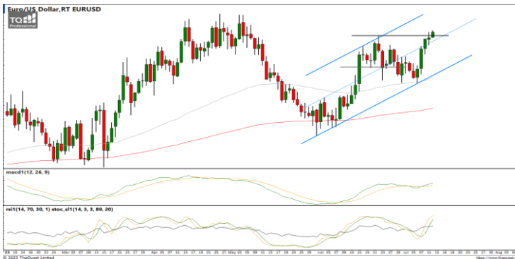
กลยุทธ์ ปิดสถานะ Short 1.0958 ลดความเสี่ยงหลังหลุด Stop >1.1012 วันนี้นั้นแนะนำ Wait and see.

USDTHB : ภาพรายวัน ราคายังคงอ่อนตัวลงพยายามทำจุดต่ำสุดใหม่ในภาพระยะสั้นทดสอบแนวรับที่ EMA200 วัน ขณะที่เครื่องมือทางเทคนิค MACD, RSI และ SSTO ให้สัญญาณขาย ทำให้คาดว่าราคามีโอกาสอ่อนตัวลงได้ต่อ แนวรับ 34.60 / 34.20 แนวต้าน 34.90 / 35.10