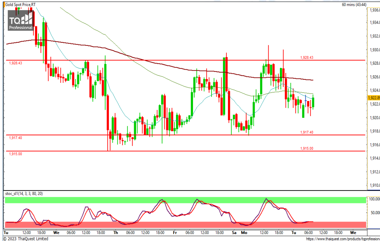
CHART INSIGHT | Gold Futures