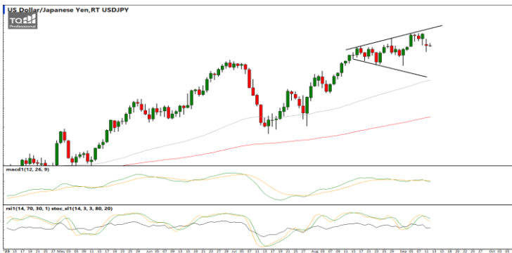
กลยุทธ์ Trading ในรอบ 144.40 – 148.30

แนวรับ 1.0723 / 1.0635 แนวต้าน 1.0765 / 1.0806