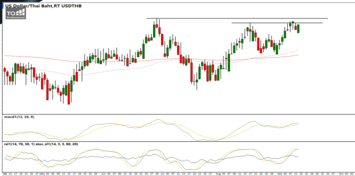
กลยุทธ์ ๑๑ Open Short 35.70 / 35.90 Stop >36.00

USDTHB : ภาพรายวัน ราคาเริ่มชะลอกำลังลงบ้างหลังพยายามขึ้นทดสอบแนวต้านที่จุดสูงสุดก่อนหน้า ขณะที่เครื่องมือทางเทคนิค MACD, RSI และ SSto ยังให้สัญญาณซื้อ ทำให้คาดว่าราคามีโอกาสแกว่งตัวออกด้านข้างอิงทางบวกได้