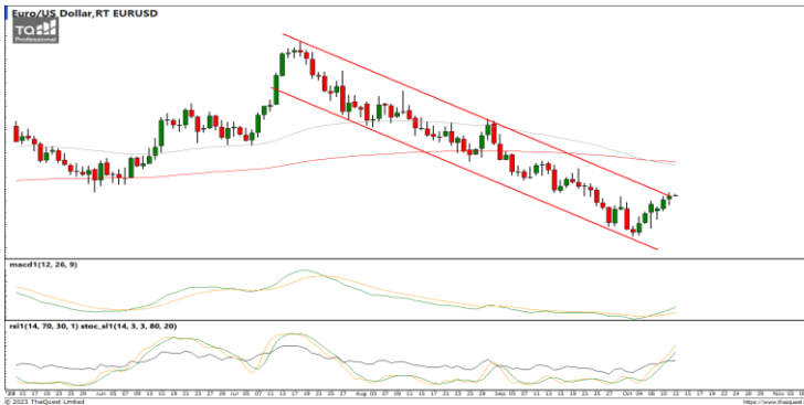
กลยุทธ์ Trading ในกรอบ 1.0520 – 1.0632

USDTHB : ภาพรายวัน ราคาปรับตัวลงต่อเนื่องหลังหลุดแนวรับที่เส้นแนวโน้มขาขึ้นทำจุดต่ำสุดใหม่ในภาวะระยะสั้น ขณะที่เครื่องมือทางเทคนิค MACD, RSI และ SSto ให้สัญญาณขาย ทำให้คาดว่าราคามีโอกาสแกว่งตัวลงได้ต่อ แนวรับ 36.25 / 35.85 แนวต้าน 36.50 / 36.75