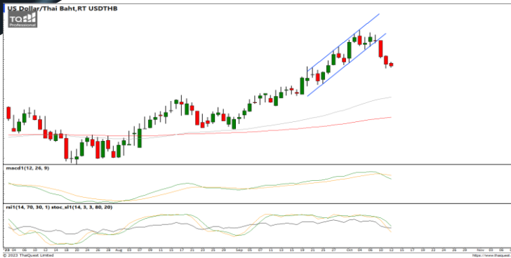
กลยุทธ์ Open Short 36.75 / 37.00 Stop >37.20

USDTHB : ภาพรายวัน ราคาปรับตัวลงต่อเนื่องหลังหลุดแนวรับที่เส้นแนวโน้มขาขึ้นทำจุดต่ำสุดใหม่ในภาวะระยะสั้น ขณะที่เครื่องมือทางเทคนิค MACD, RSI และ SSto ให้สัญญาณขาย ทำให้คาดว่าราคามีโอกาสแกว่งตัวลงได้ต่อ แนวรับ 36.25 / 35.85 แนวต้าน 36.50 / 36.75