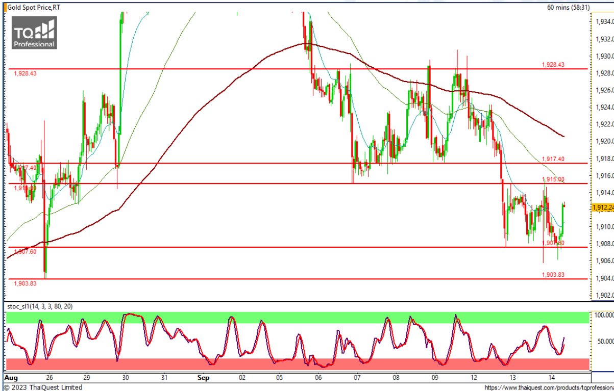
CHART INSIGHT | Gold Futures