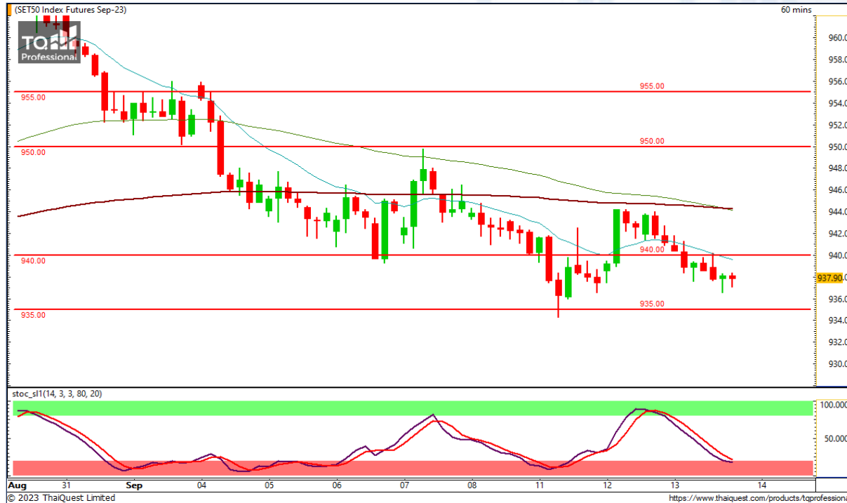
CHART INSIGHT SET50 Index Futures