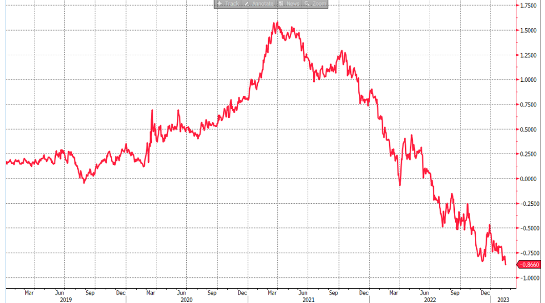
รูปที่ 1: 2s10s spread ของสหรัฐฯ

ณัฐชาติ เมฆมาสิน, CFA, FRM เลขทะเบียนนักวิเคราะห์: 031379 nuttachart@trinitythai.com