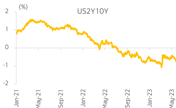
Figure 3: US yield curve is flattening with 2Y yield rising to 4.707% and long-dated falling to 3.794%