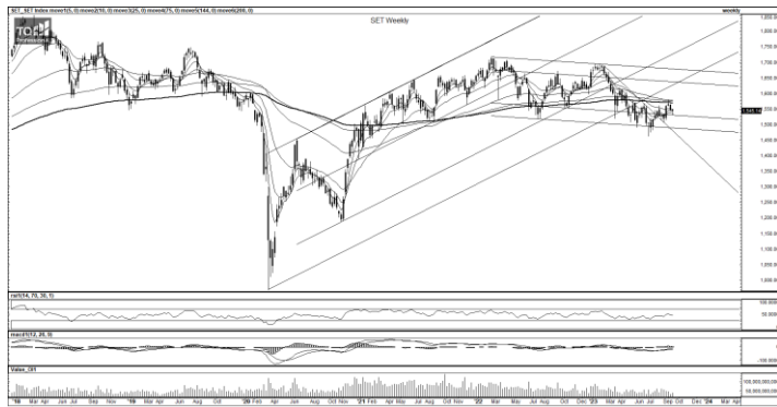
ที่มา: TQ Professional, TF weekly

กลยุทธ์การลงทุน SET Index ไหลลงมาทดสอบ Trend Line ก่อนดีดกลับมาปิดบวก พร้อม Indicator RSI ดัชนีเล็กน้อย ระยะสั้นใช้บริเวณแนวรับ 1,540/1,530 เป็นเกณฑ์ยืนได้ล้นพื้นตัวมีแนวต้าน 1,550/1,560