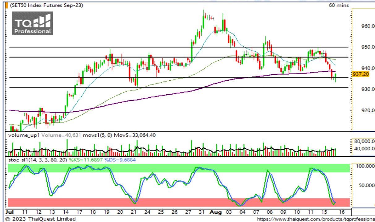
CHART INSIGHT SET50 Index Futures