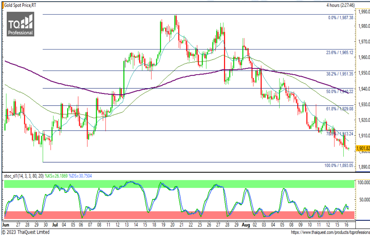
CHART INSIGHT | Gold Futures