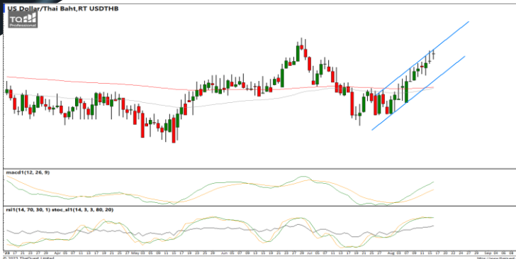
กลยุทธ์ Trading ในกรอบ 34.80 – 35.50

USDTHB : ภาพรายวัน ราคายังคงแกว่งตัวขึ้นทำจุดสูงสุดใหม่ในภาพระยะสั้นต่อเนื่องแต่เริ่มชะลอกำลังลงบ้างแล้ว ขณะที่เครื่องมือทางเทคนิค MACD และ RSI ให้สัญญาณซื้อ แต่ SSTO อยู่ในภาวะ Overbought แล้ว ทำให้คาดว่าราคามีโอกาสแกว่งตัวออกด้านข้างอิงทางบวกได้ แนวรับ 34.80 / 34.30 แนวต้าน 35.50 / 35.70