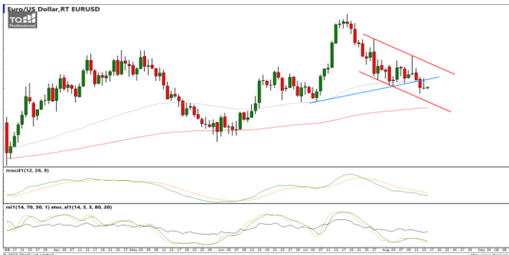
กลยุทธ์ Trading Short ในกรอบ 1.0960 – 1.0810

USDTHB : ภาพรายวัน ราคายังคงแกว่งตัวขึ้นทำจุดสูงสุดใหม่ในภาพระยะสั้นต่อเนื่องแต่เริ่มชะลอกำลังลงบ้างแล้ว ขณะที่เครื่องมือทางเทคนิค MACD และ RSI ให้สัญญาณซื้อ แต่ SSTO อยู่ในภาวะ Overbought แล้ว ทำให้คาดว่าราคามีโอกาสแกว่งตัวออกด้านข้างอิงทางบวกได้ แนวรับ 34.80 / 34.30 แนวต้าน 35.50 / 35.70