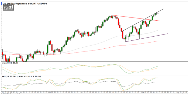
กลยุทธ์ Trading ในกรอบ 144.00 – 146.00

EURUSD : ภาพรายวัน ราคาติดตัวขึ้นทดสอบแนวต้านที่เส้นแนวโน้มขาขึ้นก่อนหน้าแล้วไม่ผ่านอ่อนตัวลงอีกครั้ง ขณะที่เครื่องมือทางเทคนิค MACD ให้สัญญาณขาย พร้อม RSI และ SSTO ยังอ่อนกำลังอยู่ ทำให้คาดว่าราคามีโอกาสแกว่งตัวลงได้ต่อ แนวรับ 1.0875 / 1.0810 แนวต้าน 1.0940 / 1.0960