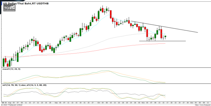
กลยุทธ์ Trading ในรอบ 35.35 – 35.75

USDTHB : ภาพรายวัน ราคาอ่อนตัวลงเริ่มเข้าใกล้แนวรับที่จุดต่ำสุดก่อนหน้าแล้วพยายามฟื้นตัวขึ้น ขณะที่เครื่องมือทางเทคนิค MACD, RSI และ SSto ยังอ่อนกำลังอยู่ ทำให้คาดว่าราคามีโอกาสแกว่งตัวออกด้านข้างได้ต่อ แนวรับ 35.35 / 35.00 แนวต้าน 35.75 / 36.15