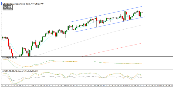
กลยุทธ์ hold Short 151.0 รอเปิดเพิ่ม 152.0 Stop > 153.0

EURUSD : ภาพรายวัน ราคาขึ้นทดสอบแนวต้านที่รอบทิศทางแนวโน้มขาขึ้นแล้วชะลอกำลังลงบ้างเล็กน้อย ขณะที่เครื่องมือทางเทคนิค MACD ให้สัญญาณซื้อ แต่ RSI และ SSto ชะลอกำลังบ้างแล้ว ทำให้คาดว่าราคามีโอกาสแกว่งตัวออกด้านข้างได้ แนวรับ 1.0790 / 1.0740 แนวต้าน 1.0890 / 1.0950