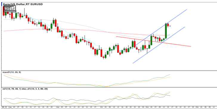
กลยุทธ์ Trading ในรอบ 1.0740 – 1.0950

USDTHB : ภาพรายวัน ราคาอ่อนตัวลงเริ่มเข้าใกล้แนวรับที่จุดต่ำสุดก่อนหน้าแล้วพยายามฟื้นตัวขึ้น ขณะที่เครื่องมือทางเทคนิค MACD, RSI และ SSto ยังอ่อนกำลังอยู่ ทำให้คาดว่าราคามีโอกาสแกว่งตัวออกด้านข้างได้ต่อ แนวรับ 35.35 / 35.00 แนวต้าน 35.75 / 36.15