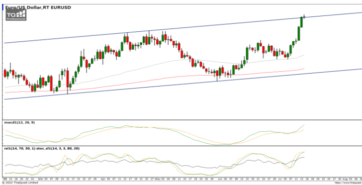
กลยุทธ์ Wait and see.

USDTHB : ภาพรายวัน ราคาเริ่มชะลอการอ่อนตัวลงบ้างหลังทำจุดต่ำสุดใหม่ในภาพระยะสั้นก่อนหน้า ขณะที่เครื่องมือทางเทคนิค MACD ให้สัญญาณขาย แต่ RSI และ SSto เริ่มชะลอการอ่อนตัวลงแล้ว ทำให้คาดว่าราคามีโอกาสแกว่งตัวออกด้านข้างได้ แนวรับ 34.40 / 34.20 แนวต้าน 34.70 / 35.10