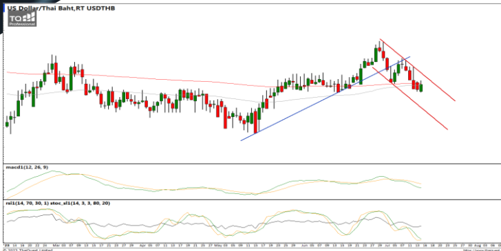
กลยุทธ์ Trading Short ในแนวรับ 34.70 – 34.40

38.2%: 119.29 51.25%: 108.98 61.6%: 99.19