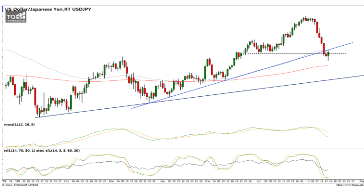
กลยุทธ์ ปิดสภาระ Short 145.00 หลังติดตัวขึ้นเหนือจุด Trailing Stop 139.00 (+6 Yen) วันนี้แนะนำ Wait and see.

EURUSD : ภาพรายวัน ราคาปรับตัวขึ้นประชิดแนวต้านที่กรอบทิศทางแนวโน้มขาขึ้นแล้วชะลอกำลังลงทำรูปแบบ Doji ขณะที่เครื่องมือทางเทคนิค MACD ให้สัญญาณซื้อ แต่ RSI และ SSto อยู่ในภาวะ Overbought แล้ว ทำให้คาดว่าราคามีโอกาสชะลอกำลังลงบ้าง แนวรับ 1.1092 / 1.1059 แนวต้าน 1.1247 / 1.1391