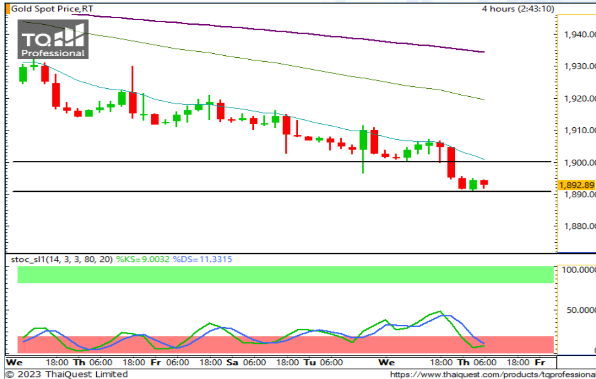
CHART INSIGHT | Gold Futures