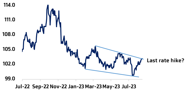
Figure 2: ทิศทางของ Dollar Index ที่ยังไม่เจอ Last rate hike ช่วยหนุน Dollar รัฐบาล