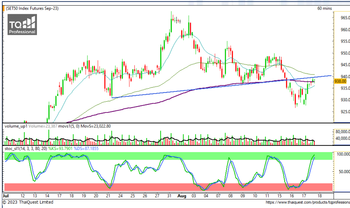
CHART INSIGHT SET50 Index Futures