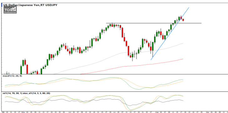
กลยุทธ์ Trading ในกรอบ 145.00 – 146.50

EURUSD : ภาพรายวัน ราคาปรับตัวลงทำจุดต่ำสุดใหม่ในภาวะระยะสั้นแล้วพยายามรื้อवादกลับขึ้นบ้าง ขณะที่เครื่องมือทางเทคนิค MACD, RSI และ SSto เริ่มบวกตัวขึ้นบ้างแล้ว ทำให้คาดว่าราคามีโอกาสรื้อवादกลับขึ้นได้ แนวรับ 1.0825 / 1.0800 แนวต้าน 1.0934 / 1.0960