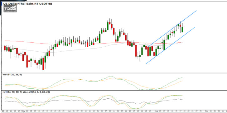
กลยุทธ์ Trading ในกรอบ 35.00 – 35.60

38.2%: 119.29 51.25%: 108.98 61.6%: 99.19