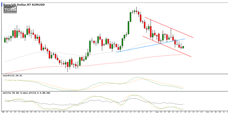
กลยุทธ์ Trading Short ในกรอบ 1.0960 – 1.0800

USDTHB : ภาพรายวัน ราคาปรับตัวขึ้น ทดสอบแนวต้านที่รอบทิศทางแนวโน้มขาขึ้นแล้ว เริ่มชะลอกำลังลงบ้างแล้ว ขณะที่เครื่องมือทางเทคนิค MACD, RSI และ SSto เริ่มชะลอกำลังลงเช่นกัน ทำให้คาดว่าราคามีโอกาสแกว่งตัวออกด้านข้างได้ แนวรับ 35.00 / 34.60 แนวต้าน 35.55 / 35.70