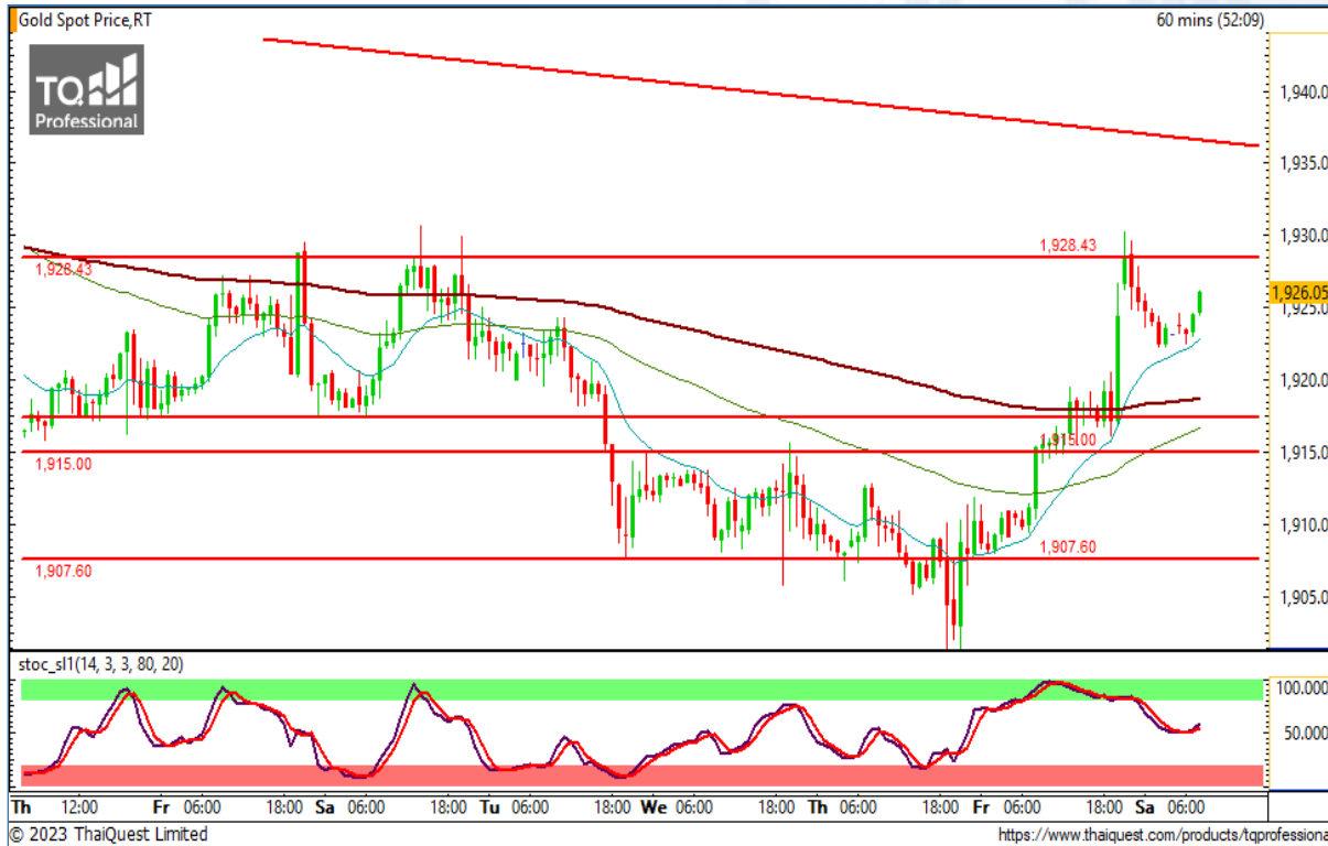
CHART INSIGHT | Gold Futures