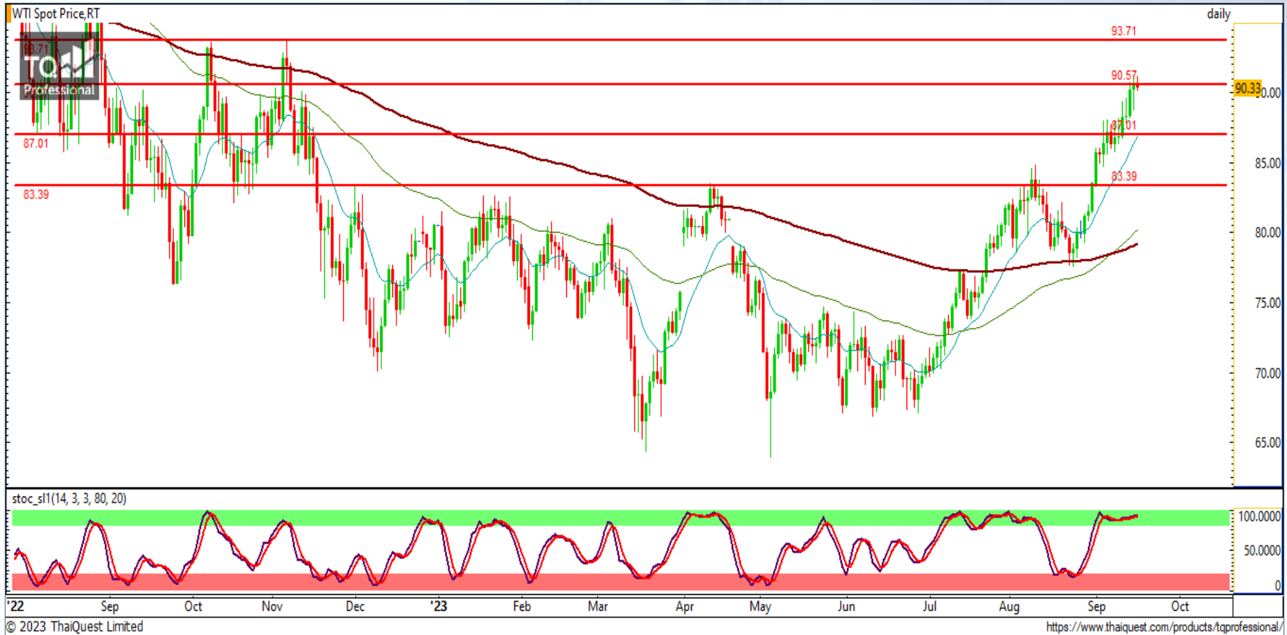
CHART INSIGHT Commodity Market