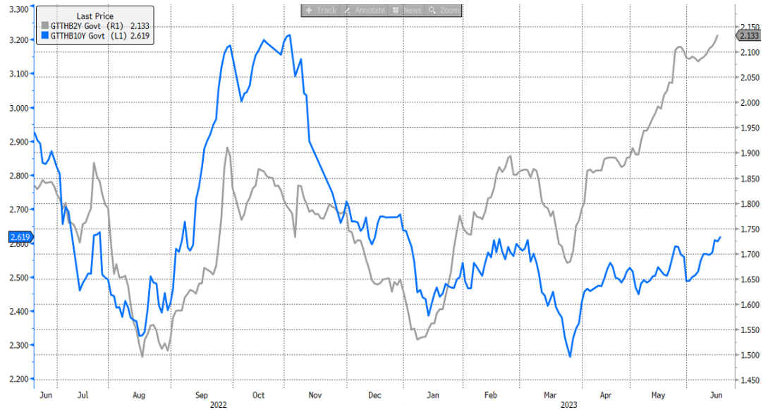
รูปที่ 1: Bond yield ของไทยทั้งรุ้นสั้นและรุ้นยาวต่างทำจุดสูงสุดใหม่ของปีนี้