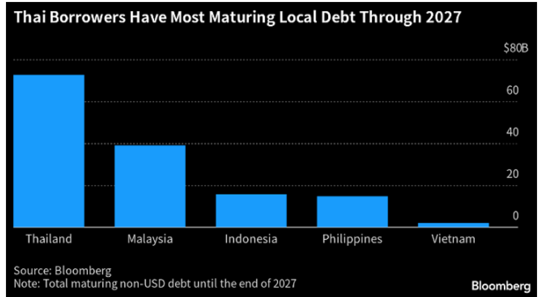
รูปที่ 2: บจ ของไทยถือเป็นประเทศที่จะมีหนี้ครบกำหนดภายในปี.2027 มากสุดใน ASEAN