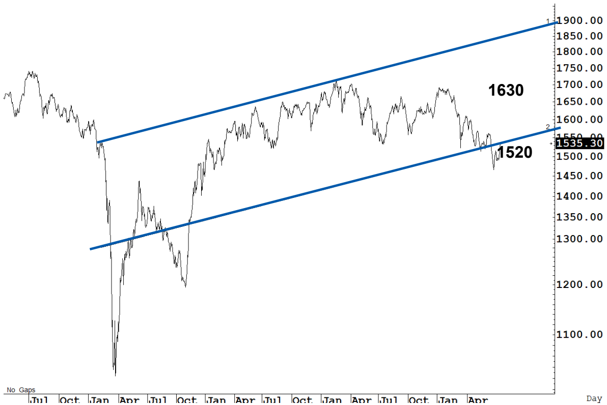
Figure 1 : SET Index daily chart