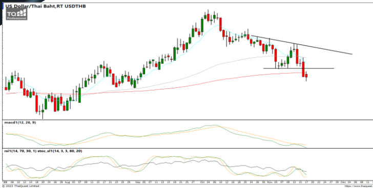
กลยุทธ์ Trading ในรอบ 34.70 – 35.35

USDTHB : ภาพรายวัน ราคาปรับตัวลงทำจุดต่ำสุดใหม่ในภาพระยะสั้น ขณะที่เครื่องมือทางเทคนิค MACD, RSI และ SSto ให้สัญญาณขาย ทำให้คาดว่าราคามีโอกาสอ่อนตัวลงได้ต่อ