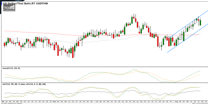
กลยุทธ์ Trading ในกรอบ 35.00 – 35.60

38.2%: 119.29 51.25%: 108.98 61.6%: 99.19