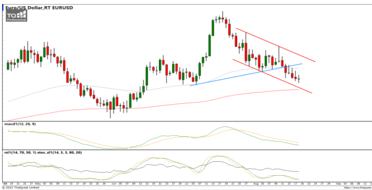
กลยุทธ์ Trading Short ในกรอบ 1.0960 – 1.0800

USDTHB : ภาพรายวัน ราคาเริ่มชะลอกำลังลงบ้างแล้วหลังปรับตัวขึ้นทดสอบแนวต้านที่กรอบทิศทางแนวโน้มขาขึ้น ขณะที่เครื่องมือทางเทคนิค MACD, RSI และ SSto เริ่มชะลอกำลังลงเช่นกัน ทำให้คาดว่าราคามีโอกาสแกว่งตัวออกด้านข้างได้ แนวรับ 35.00 / 34.60 แนวต้าน 35.55 / 35.70