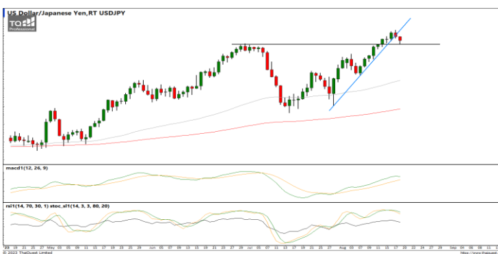
กลยุทธ์ Trading ในกรอบ 145.00 – 146.50

EURUSD : ภาพรายวัน ราคาปรับตัวลงทำจุดต่ำสุดใหม่ในภาพระยะสั้นอีกครั้งแต่เริ่มชะลอการอ่อนตัวลงทำรูปแบบ Doji ขณะที่เครื่องมือทางเทคนิค MACD ยังให้สัญญาณขาย แต่ RSI และ SSto เริ่มชะลอการอ่อนตัวลง ทำให้คาดว่าราคามีโอกาสแกว่งตัวออกด้านข้างได้ แนวรับ 1.0825 / 1.0800 แนวต้าน 1.0930 / 1.0960