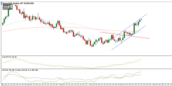
กลยุทธ์ Trading ในรอบ 1.0890 – 1.1000

USDTHB : ภาพรายวัน ราคาปรับตัวลงทำจุดต่ำสุดใหม่ในภาวะระยะสั้นแล้วชะลอการอ่อนตัวลงบ้างแล้วพยายามรีบาวด์ขึ้นบ้างเล็กน้อย ขณะที่เครื่องมือทางเทคนิค MACD ให้สัญญาณขาย แต่ RSI และ SSto พยายามฟื้นตัวขึ้นทำให้คาดว่าราคามีโอกาสรีบาวด์ได้บ้างในระยะสั้น แนวรับ 34.95 / 34.70 แนวต้าน 35.35 / 35.75