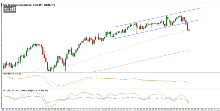
กลยุทธ์ Hold Short 151.0 Let's Profit Run Stop >153.0

EURUSD : ภาพรายวัน ราคายังแกว่งตัวขึ้นทำจุดสูงสุดใหม่ประชิดแนวต้านที่กรอบทิศทางแนวนิมขาขึ้นต่อเนื่อง ขณะที่เครื่องมือทางเทคนิค MACD ให้สัญญาณซื้อ แต่ RSI และ SSto อยู่ในภาวะ Overbought ทำให้คาดว่าราคามีโอกาสแกว่งตัวออกด้านข้างอิงทางบวกได้ แนวรับ 1.0890 / 1.0780 แนวต้าน 1.0980 / 1.1000