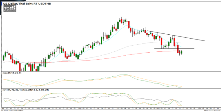
กลยุทธ์ Trading ในรอบ 34.70 – 35.35

USDTHB : ภาพรายวัน ราคาปรับตัวลงทำจุดต่ำสุดใหม่ในภาวะระยะสั้นแล้วชะลอการอ่อนตัวลงบ้างแล้วพยายามรีบาวด์ขึ้นบ้างเล็กน้อย ขณะที่เครื่องมือทางเทคนิค MACD ให้สัญญาณขาย แต่ RSI และ SSto พยายามฟื้นตัวขึ้นทำให้คาดว่าราคามีโอกาสรีบาวด์ได้บ้างในระยะสั้น แนวรับ 34.95 / 34.70 แนวต้าน 35.35 / 35.75