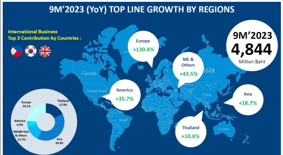
Fig 2: 9M23 Revenue growth by regions