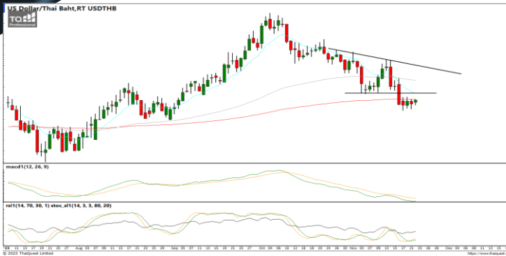
กลยุทธ์ Trading ในรอบ 34.70 – 35.35

USDTHB : ภาพรายวัน ราคาแกว่งตัวออกด้านข้างในกรอบจำกัดหลังปรับตัวลงทำจุดต่ำสุดใหม่ในภาพระยะสั้น ขณะที่เครื่องมือทางเทคนิค MACD, RSI และ SSto ยังอ่อนกำลังอยู่ ทำให้คาดว่าราคามีโอกาสแกว่งตัวออกด้านข้างได้ต่อเนื่อง แนวรับ 34.95 / 34.70 แนวต้าน 35.35 / 35.75