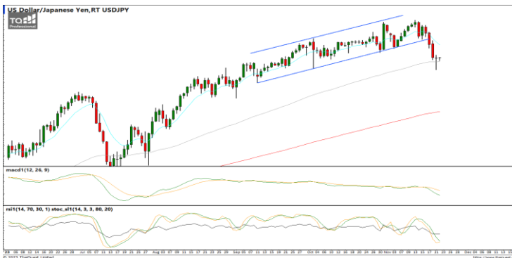
กลยุทธ์ Hold Short 151.0 Let's Profit Run Stop >151.0

EURUSD : ภาพรายวัน ราคาปรับตัวขึ้นทดสอบแนวต้านที่กรอบทิศทางแนวโน้มขาขึ้นแล้วชะลอกำลังลงบ้างแล้ว ขณะที่เครื่องมือทางเทคนิค MACD ให้สัญญาณซื้อ แต่ RSI และ SSto เริ่มอ่อนตัวลงบ้างแล้ว ทำให้คาดว่าราคามีโอกาสย่อตัวลงได้บ้าง แนวรับ 1.0890 / 1.0780 แนวต้าน 1.0980 / 1.1000