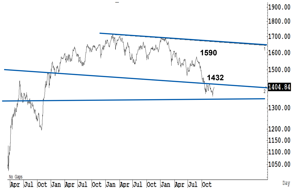
Figure 1 : SET Index daily chart