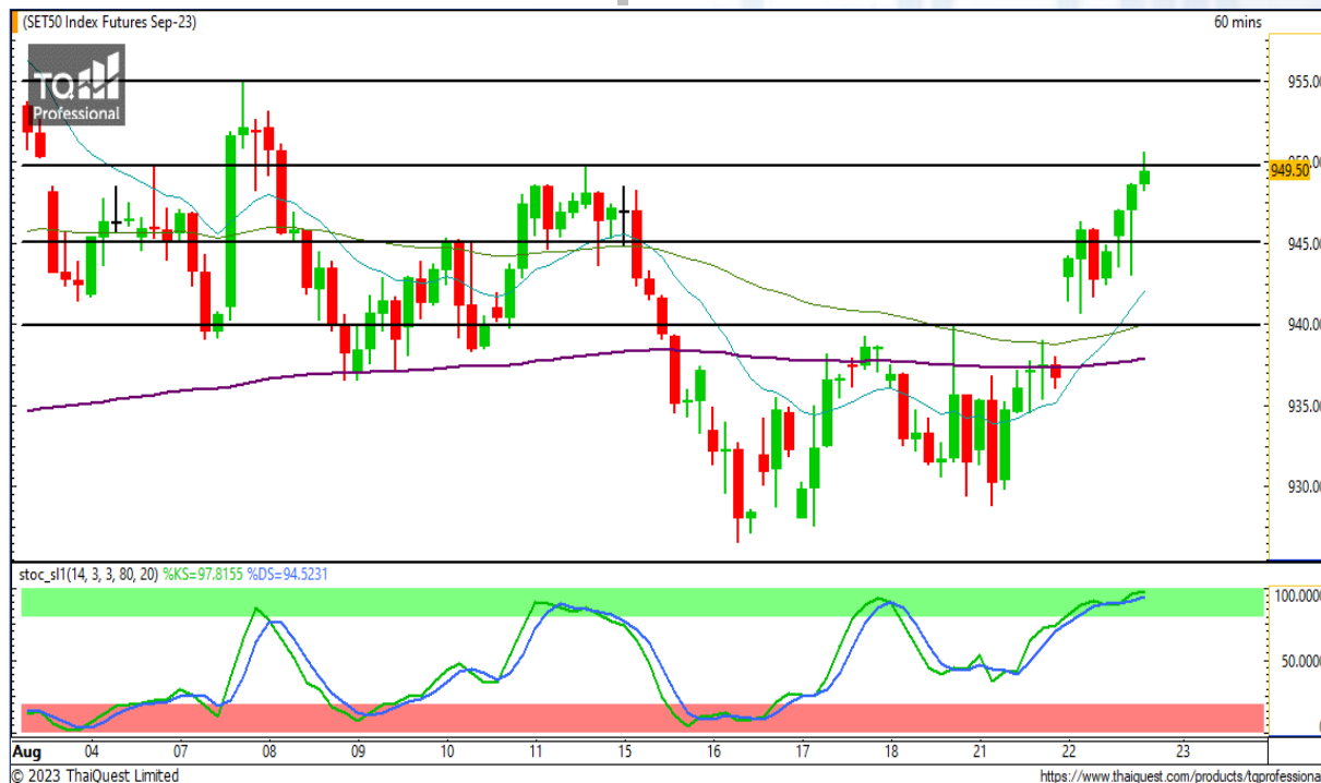
CHART INSIGHT SET50 Index Futures