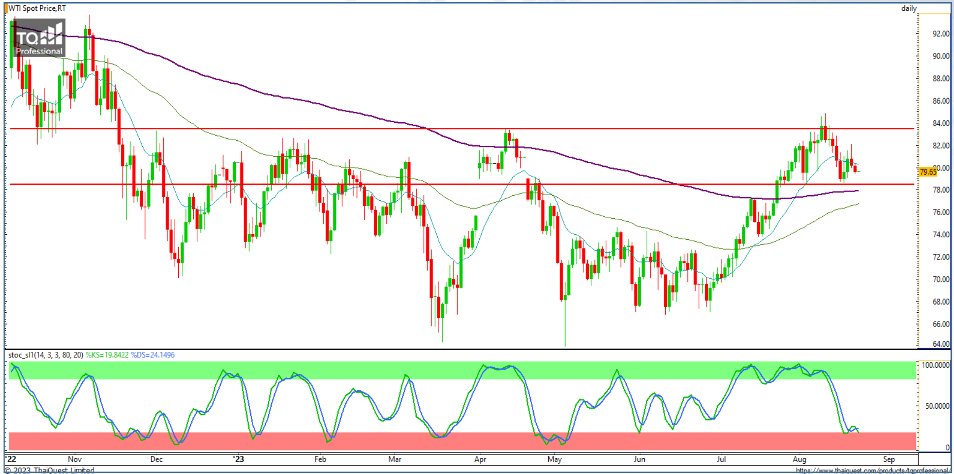
CHART INSIGHT Commodity Market