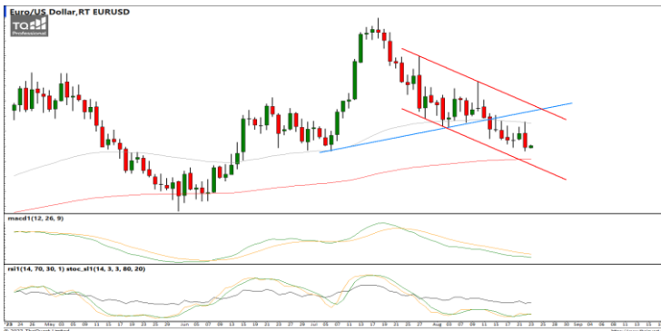
กลยุทธ์ Trading Short ในรอบ 1.0930 – 1.0810

แนวรับ 34.60 / 34.00 แนวต้าน 35.20 / 35.40