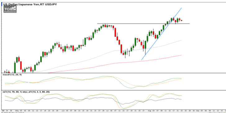
กลยุทธ์ Trading ในรอบ 145.00 – 146.50

แนวรับ 1.0808 / 1.0780 แนวต้าน 1.0872 / 1.0927