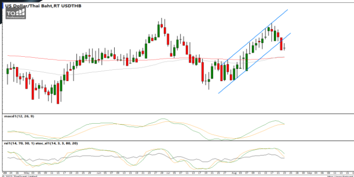
กลยุทธ์ Trading Short ในรอบ 35.20 – 34.00

USDTHB : ภาพรายวัน ราคาปรับตัวลง หลุดกรอบทิศทางแนวโน้มขาขึ้นพยายามทำจุดต่ำสุดใหม่ในภาวะระยะสั้น ขณะที่เครื่องมือทางเทคนิค MACD วกตัวลง พร้อม RSI และ SSto อ่อนกำลังลงแล้ว ทำให้คาดว่าราคามีโอกาสแกว่งตัวลงได้