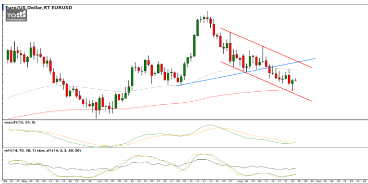
กลยุทธ์ Trading Short ในรอบ 1.0926 – 1.0810

USDTHB : ภาพรายวัน ราคาพยายามฟื้นตัวขึ้นทดสอบแนวต้านที่กรอบทิศทางแนวโน้มขาขึ้นก่อนหน้านี้แล้วไม่ผ่านอ่อนตัวลงอีกครั้ง ขณะที่เครื่องมือทางเทคนิค MACD, RSI และ SSto ให้สัญญาณขาย ทำให้คาดว่าราคามีโอกาสอ่อนตัวลงได้ต่อ แนวรับ 34.60 / 34.00 แนวต้าน 35.20 / 35.40