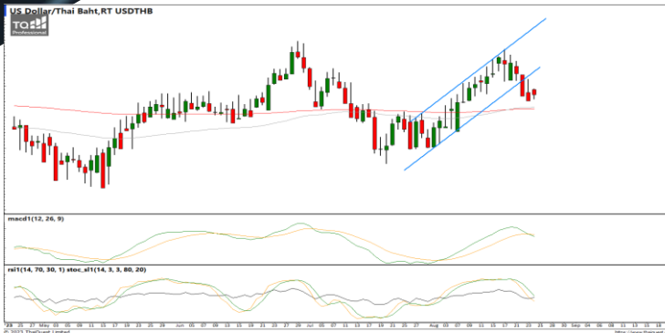
กลยุทธ์ Trading Short ในรอบ 35.20 – 34.00

38.2%: 119.29 51.25%: 108.98 61.6%: 99.19