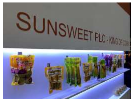
Fig 2: Ready to Eat products