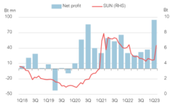
Fig 3: SUN share prices vs profits