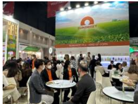
Fig 1: บูธของ SUN ในงาน THAIFEX – Anuga Asia 2023

คงราคาเป้าหมายที่ 9.50 บาท อิง PER 18.0x เราชอบ SUN จาก valuation ที่ไม่แพงโดยเทรดที่ PER 12.1x เทียบกับกำไรพื้นฐานตัวอย่างมีนัยสำคัญ 2022-24E EPS CAGR ที่ 78% และยังมี upside จากกำลังการผลิตที่เพิ่มขึ้นจาก Hydrolock, การขยายตลาดสู่ประเทศใหม่ๆ และ M&A