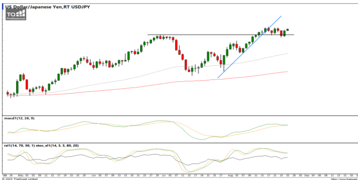
กลยุทธ์ Hold Short 145.00 รอเปิดเพิ่ม 146.50 Stop >146.60

EURUSD : ภาพรายวัน ราคาปรับตัวลงทำจุดต่ำสุดใหม่ในภาวะชะงักในกรอบทิศทางแนวโน้มขาลงต่อเนื่อง ขณะที่เครื่องมือทางเทคนิค MACD, RSI และ SSto ยังคงให้สัญญาณขาย ทำให้คาดว่าราคามีโอกาสแกว่งตัวลงได้ต่อ แนวรับ 1.0770 / 1.0680 แนวต้าน 1.0833 / 1.0926