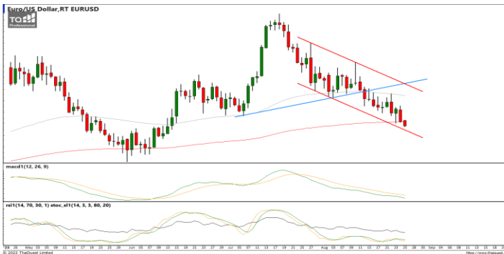
กลยุทธ์ Trading Short ในรอบ 1.0876 – 1.0770

USDTHB : ภาพรายวัน ราคาพยายามรีบาวด์กลับขึ้นบ้างหลังหลุดแนวรับที่เส้นแนวโน้มขาขึ้น ขณะที่เครื่องมือทางเทคนิค MACD, RSI และ SSto ยังอ่อนกำลังอยู่ ทำให้คาดว่าราคามีโอกาสแกว่งตัวออกด้านข้างได้ แนวรับ 34.60 / 34.00 แนวต้าน 35.20 / 35.40