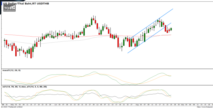
กลยุทธ์ Trading Short ในรอบ 35.20 – 34.00

38.2%: 119.29 51.25%: 108.98 61.6%: 99.19