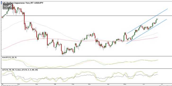
กลยุทธ์ Open Short 145.00 / 146.00 Stop >147.00

EURUSD : ภาพรายวัน ราคาปรับตัวลงทำจุดต่ำสุดใหม่ในภาวะระยะสั้นและหลุด Middle Line ในกรอบขาขึ้นแล้วพยายามรีบาวด์กลับขึ้นบ้าง ขณะที่เครื่องมือทางเทคนิค MACD, RSI และ SSto ยังชะลอกำลังอยู่ ทำให้คาดว่าราคามีโอกาสแกว่งตัวออกด้านข้างได้ แนวรับ 1.0844 / 1.0779 แนวต้าน 1.0946 / 1.0971