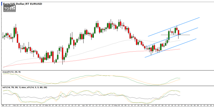
กลยุทธ์ Open Short 1.0946 / 1.0971 Stop >1.1012

USDTHB : ภาพรายวัน ราคาปรับตัวขึ้นทำจุดสูงสุดใหม่เข้าใกล้แนวต้านที่จุดสูงสุดก่อนหน้าแล้วเริ่มชะลอกำลังลงบ้าง ขณะที่เครื่องมือทางเทคนิค MACD ยังคงให้สัญญาณซื้อ แต่ RSI และ SSto อยู่ในภาวะ Overbought แล้ว ทำให้คาดว่าราคามีโอกาสแกว่งตัวออกด้านข้างได้ แนวรับ 35.10 / 34.90 แนวต้าน 35.30 / 35.40