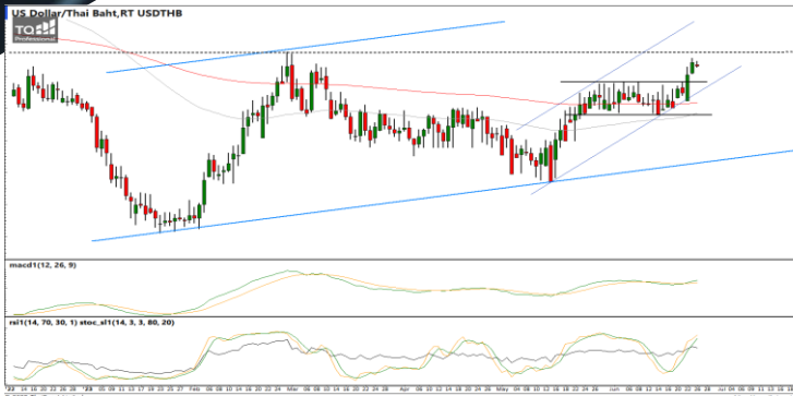
กลยุทธ์ Trading ในกรอบ 34.90 – 35.40

USDTHB : ภาพรายวัน ราคาปรับตัวขึ้นทำจุดสูงสุดใหม่เข้าใกล้แนวต้านที่จุดสูงสุดก่อนหน้าแล้วเริ่มชะลอกำลังลงบ้าง ขณะที่เครื่องมือทางเทคนิค MACD ยังคงให้สัญญาณซื้อ แต่ RSI และ SSto อยู่ในภาวะ Overbought แล้ว ทำให้คาดว่าราคามีโอกาสแกว่งตัวออกด้านข้างได้ แนวรับ 35.10 / 34.90 แนวต้าน 35.30 / 35.40