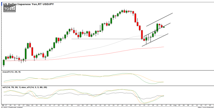
กลยุทธ์ สอ Open Short 143.60 / 144.00 Stop > 145.00

แนวรับ 1.1012 / 1.0977 แนวต้าน 1.1092 / 1.1147