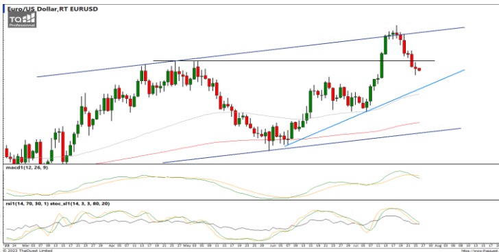
กลยุทธ์ Wait and see.

แนวรับ 34.20 / 33.70 แนวต้าน 34.60 / 34.70