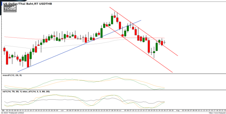
กลยุทธ์ Trading ในกรอบ 33.70 – 34.70

USDTHB : ภาพรายวัน ราคาขึ้นทดสอบ แนวต้านที่ EMA200 วัน แล้วไม่ผ่านเริ่มชะลอ กำลังลงบ้างแล้ว ขณะที่เครื่องมือทางเทคนิค MACD, RSI และ SSto พยายามยกตัวขึ้น ทำให้คาดว่าราคามีโอกาสแกว่งตัวออกด้านข้างอิงทางบวกได้