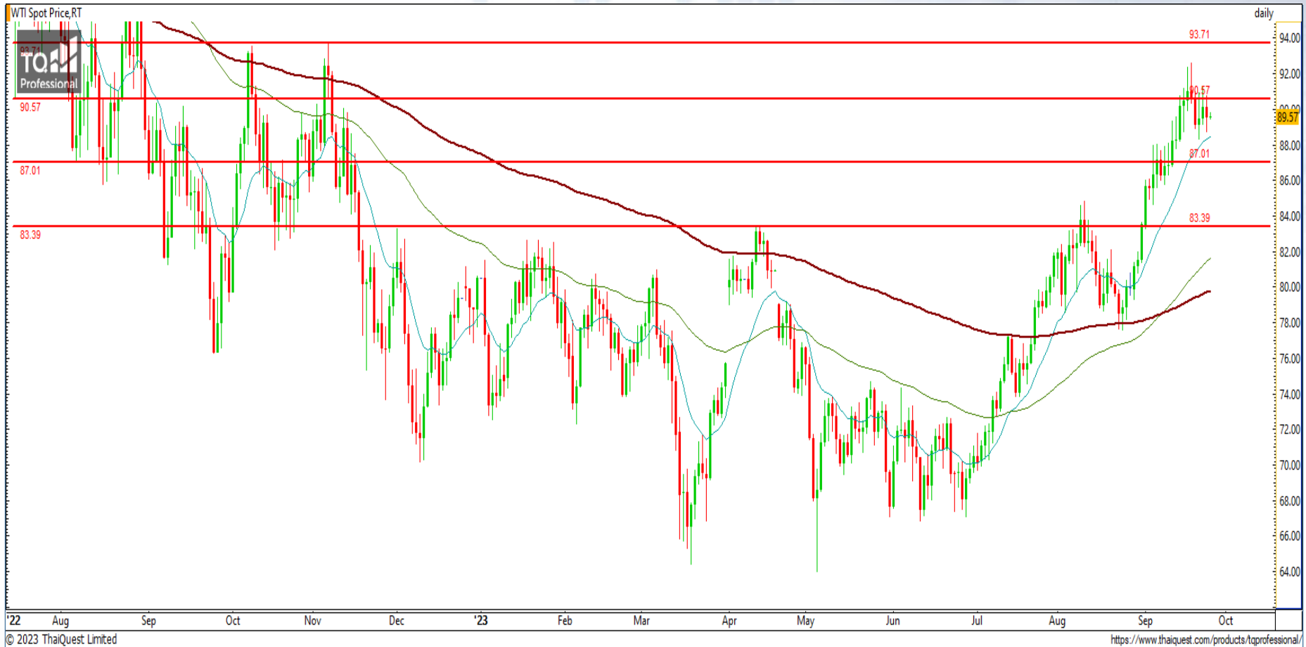
CHART INSIGHT Commodity Market