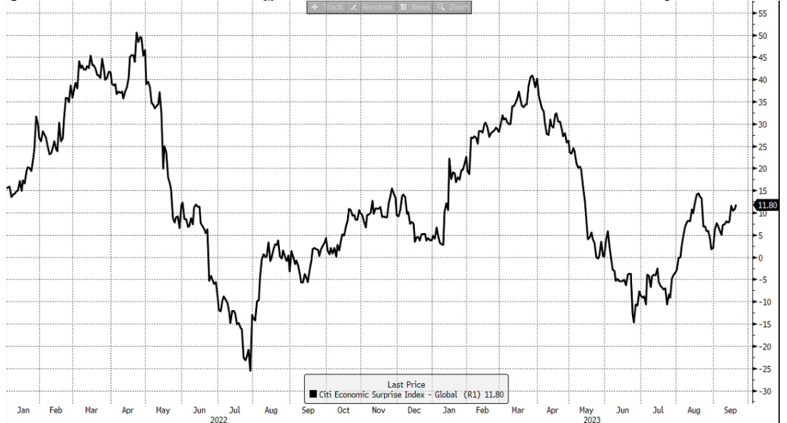
รูปที่ 2: รายงานตัวเลขเศรษฐกิจโลกในช่วงหลังค่อนข้างมี Positive surprise