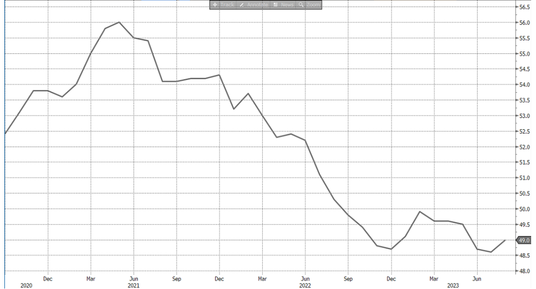
รูปที่ 1: Global PMI ภาคการผลิตมีแนวโน้มผ่านจุดต่ำสุดช่วงสั้น

3) TEGH (ราคาเป้าหมายของเรา 4.20 บาท) : ราคาของ SICOM เริ่มฟื้นตัวจากจุดต่ำสุด คาดคำสั่งซื้อจากผู้ผลิตยางล้อในจีนปรับตัวดีขึ้น จากนโยบายการกระตุ้นเศรษฐกิจของทางการจีน ทำให้ภาพรวมผลประกอบการจะดีขึ้นจาก 2Q66 ขณะที่ธุรกิจปาล์มจะเข้าช่วง High Season ใน 2H66 นอกจากนี้ยังคาดว่าจะได้ผลจากการติดตั้งหมอนิ่งใหม่ที่จะแก้ปัญหาคอขวดที่เกิดขึ้นในปีก่อน ส่งผลให้ผลประกอบการในครึ่งปีหลังจะฟื้นตัวดีขึ้นตามลำดับ ราคาเป้าหมายของเราที่ 4.2 บาท ถึง PER 10x เท่านั้น