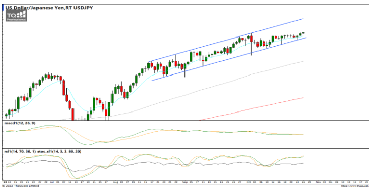
กลยุทธ์ Wait and see.

EURUSD : ภาพรายวัน ราคาอ่อนตัวลงเข้าใกล้แนวรับที่รอบทิศทางแนวโน้มขาขึ้นแล้ว ขณะที่เครื่องมือทางเทคนิค MACD, RSI และ SSto ยังอ่อนกำลังอยู่ ทำให้คาดว่าราคามีโอกาสแกว่งตัวออกด้านข้างได้ต่อ แนวรับ 1.0550 / 1.0494 แนวต้าน 1.0620 / 1.0700