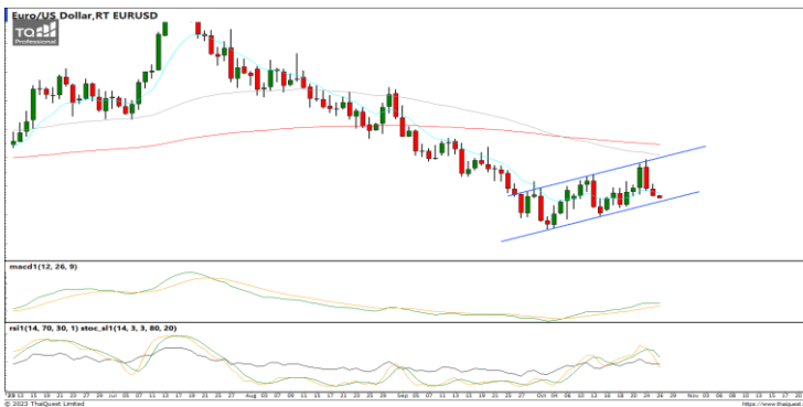
กลยุทธ์ Trading ในกรอบ 1.0550 – 1.0700

USDTHB : ภาพรายวัน ราคาลงทดสอบแนวรับที่จุดต่ำสุดก่อนหน้าแล้วพยายามฟื้นตัวกลับขึ้นได้ ขณะที่เครื่องมือทางเทคนิค MACD, RSI และ SSto ชะลอการอ่อนตัวลง ทำให้คาดว่าราคามีโอกาสแกว่งตัวออกด้านข้างได้ แนวรับ 36.00 / 35.70 แนวต้าน 36.35 / 36.50