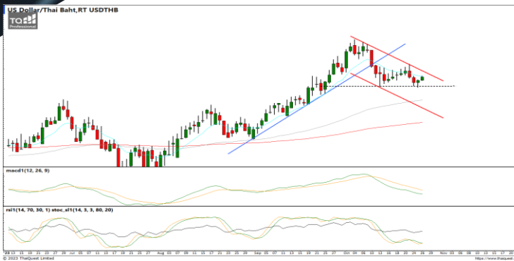
กลยุทธ์ Open Short 36.35 / 36.40 Stop >36.65

USDTHB : ภาพรายวัน ราคาลงทดสอบแนวรับที่จุดต่ำสุดก่อนหน้าแล้วพยายามฟื้นตัวกลับขึ้นได้ ขณะที่เครื่องมือทางเทคนิค MACD, RSI และ SSto ชะลอการอ่อนตัวลง ทำให้คาดว่าราคามีโอกาสแกว่งตัวออกด้านข้างได้ แนวรับ 36.00 / 35.70 แนวต้าน 36.35 / 36.50