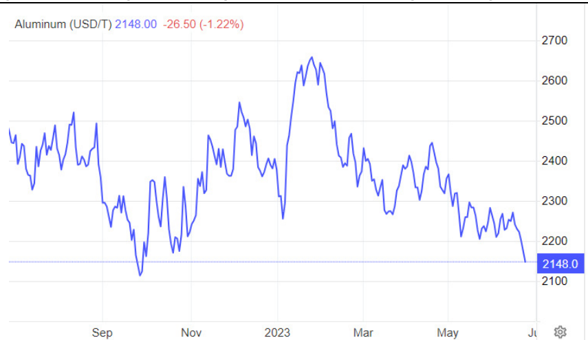
Figure 2: Declining aluminium price trend led to better gross margin in 2Q23